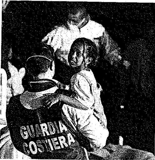
29 Kinder befanden sich an Bord des Flüchtlingssschiffes

Nach mehrtägiger Irrfahrt rettet die italienische Küstenwache 297 Bootsflüchtlinge. Zunächst hatte Italien die Hilfe verweigert